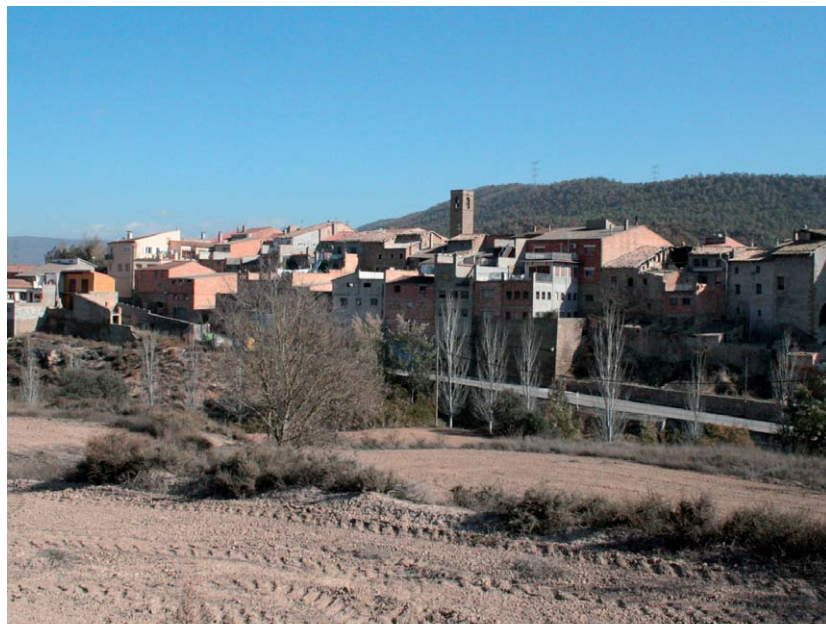
Vista general del municipi de Vilanova de l'Aguda (Noguera).