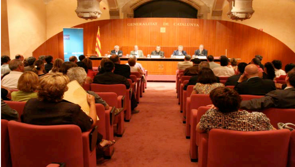
Cloenda de la Diplomatura de Postgrau en Gestió i Administració local, 2009

Nombre alumnes de les 4 edicions: 86. Treball recerca: 26.