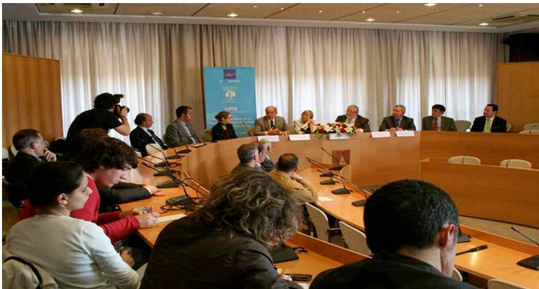
Signatura del conveni de creació de la Càtedra a l'edifici del Rectorat de la UAB

Fruit de la col·laboració entre la Universitat Autònoma de Barcelona (UAB) i la Fundació privada Aula d'Alts Estudis d'Electes (FAAEE) en matèria de formació i transferència de coneixement científic en els àmbits del dret, la hisenda i la gestió dels ens locals, ambdues institucions van acordar, el dia 14 d'abril de 2009, la creació de la Càtedra Enric Prat de la Riba d'Estudis Jurídics Locals (Annex núm. 1).