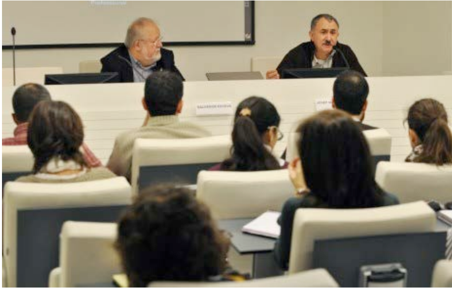
Sessió de treball amb el sr. Josep Maria Álvarez, secretari general d'UGT

2.- Matinals Prat de la Riba. Seminari d'actualització per a electes locals. Aquest programa, que es desenvolupa amb periodicitat bimensual, pretén posar al dia de les novetats normatives i jurisprudencials que afecten l'àmbit jurídic local, així com a analitzar i debatre blocs temàtics d'actualitat i interès tant des d'una perspectiva teòrica com pràctica (Annex núm. 7).